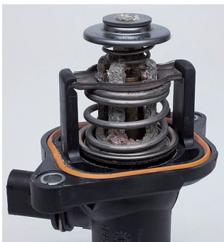
Figure 1: Obvious signs of corrosion on a map-controlled thermostat (Type TM).

To prevent this phenomenon, fill the cooling circuit with manufacturer-approved coolant additives only, taking care to use the proper ratio of coolant to water. Some vehicle manufacturers also prescribe the use of distilled water. Equipotential bonding between the engine and car body must also be ensured: earthing cables must not show signs of damage (see Figure 3).