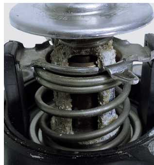
Figure 2: The aluminium has been completely eaten away due to the use of non-approved coolant additives.