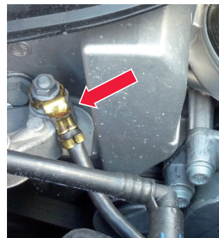
Figure 3: Check the earthing cable to ensure it is properly connected and free of damage.

IMPORTANT! Coolant ages too! Regular coolant changes prevent sludge accumulating in the cooling circuit. Always follow the vehicle manufacturer's instructions!