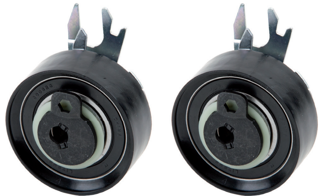
Bild 1: Links - Spannrolle 531 0252 30, rechts - Spannrolle 531 0525 30