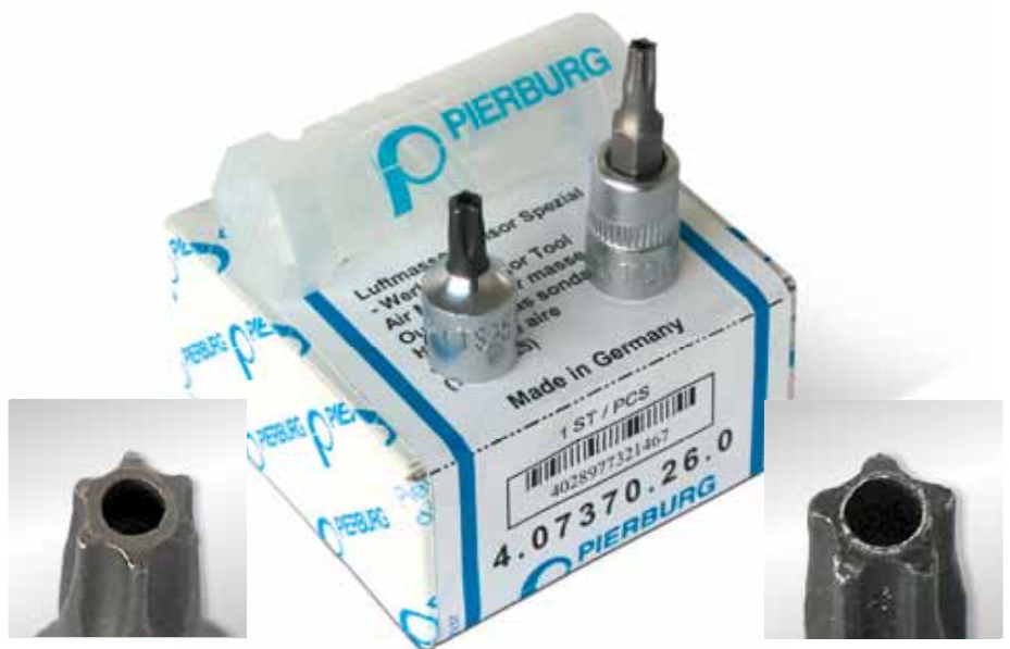
Einsatz T 20 (6-Stern, Torx®) mit Stirnlochbohrung

Es handelt sich bei den beiden Werkzeugen um 1/4-Zoll-Einsätze in bewährter MSI-Qualität, passend zu allen handelsüblichen 1/4-Zoll-Knarren oder -Steckschlüsseln.