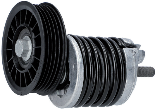
Option B | Variante B | Version B | Variante B | Variante B | Wariant B