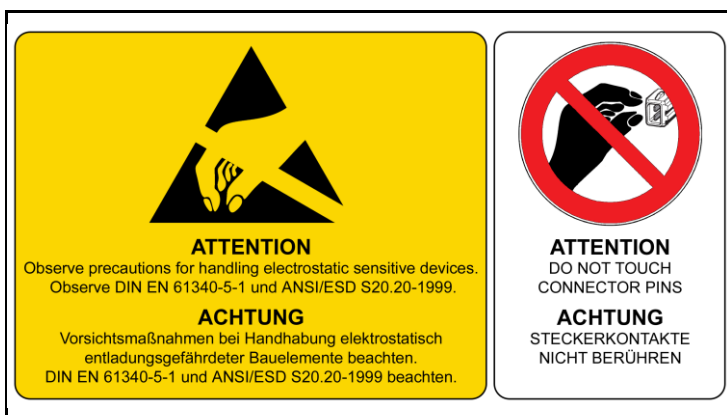
4 - ESD Hinweise / ESD Notes