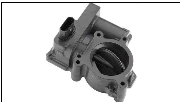
1 - Produkt / Product