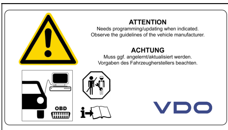
3 - Montage Hinweise / Installation Notes

Nennspannung (Positionssensor) / Nominal Voltage (Position Sensor) = 5 V