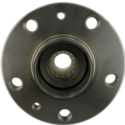
Lager mit Kunststoff Transportsicherung

Die Kunststoffhülse schützt das Radlager vor Transportschäden. Das VKBA 3497 wird mit einer Kunststoffhülse geliefert, der die Innenringe zusammenhält, bis zur Montage des Lagers.