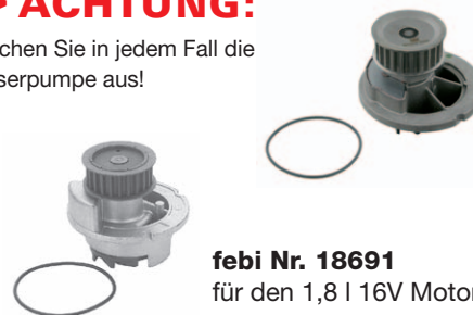
febi Nr. 18691 für den 1,8 l 16V Motor

Tauschen Sie in jedem Fall die Wasserpumpe aus!