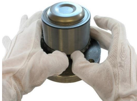
2. Schnapping leicht auseinander drücken.