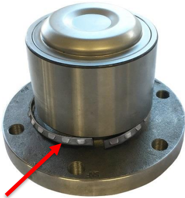
1. Schnapping vom Lager abgerutscht.