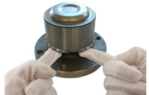
3. Drücken Sie den Schnapping auf den Lageraußenring