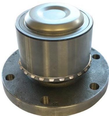
4. Schnapping in korrekter Einbauposition.