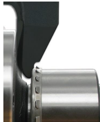
5. Nutzen Sie das SKF Montagewerkzeug VKN 600 für den Einbau des Radlagers.

Click here to watch SKF technical videos on Youtube!