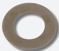
Scheibe mit Diamantbeschichtung

Die Diamantscheibe von febi verfügt über eine hochwertige Nickel-Diamantbeschichtung, diese verhindert ein Durchdrehen der Riemenscheibe. Zusätzlich wird die optimale Kraftübertragung gewährleistet. Damit kostspielige Folgeschäden vermieden werden können, ist die Diamantscheibe in den febi Reparatursätzen Schwingungsdämpfer für Volvo 850, S70, S80, V70 I, V70 II, VW Crafter/T4 und Audi A6 direkt enthalten.