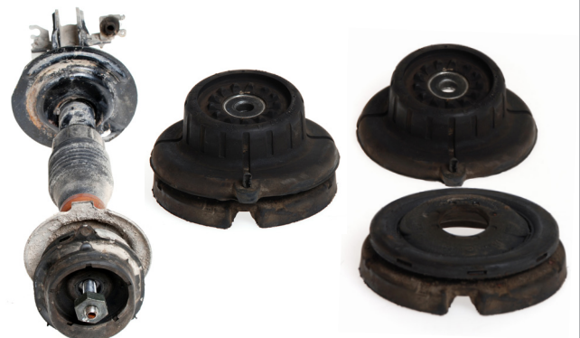
Aufbau (ohne Feder)