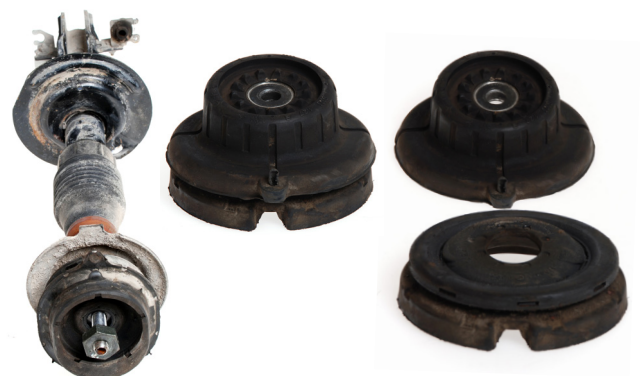
Line up (without spring)