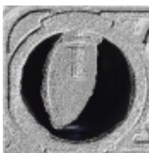
Abbildungen: neue und verrußte Drallklappe im Vergleich

Aber auch einfach verschmutzte Klappen haben eine unmittelbare Auswirkung: Drallklappen steuern die Verwirbelung der Frischluft im Motor, wodurch eine optimale Verbrennung des Kraftstoff-Luft-Gemisches erreicht wird. Je verußter die Klappen sind, desto ungenauer wird das Abgas-Luft-Gemisch gesteuert – verminderte Leistung und erhöhte Abgaswerte sind dann die unmittelbaren Symptome.