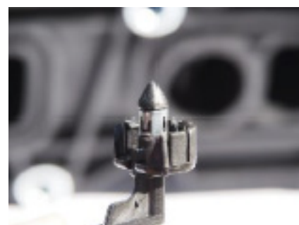
Abbildung: Stellhebel des AIC Artikels 53000Set mit Metallverstärkung

Stellhebel verbinden das Gestänge der Abgasbrücke mit dem Stellmotor, der die Steuerung der Drallklappen übernimmt. In der Vergangenheit hatte Mercedes bei diesen Abgasbrücken einen Stellhebel eingesetzt, der sich ohne zusätzliche Metallverstärkung leicht abnutzte. Seit nunmehr fünf Jahren (2008) besitzt das Mercedes-Originalteil einen metallverstärkten Stellhebel, der einen sicheren Sitz des Hebels in der Abgasbrücke garantiert.