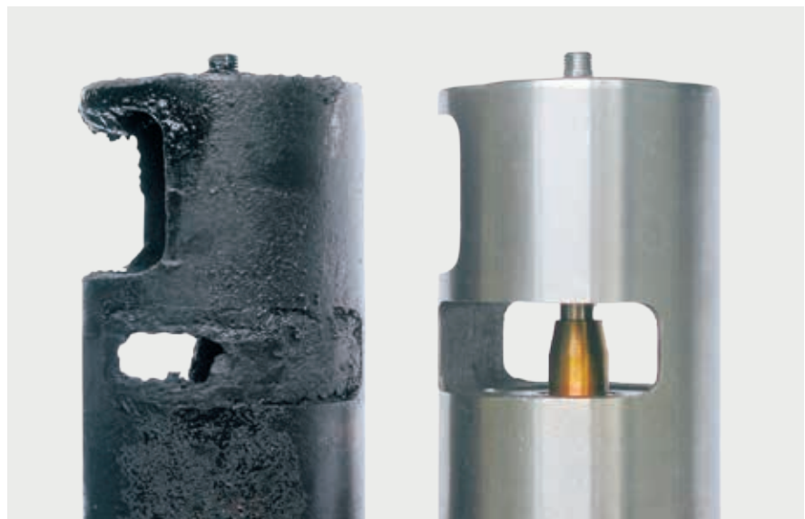
Verklebtes AGR-Ventil und Neuzustand

Zu Diagnosehinweisen und möglichen Ursachen → siehe Folgeseiten