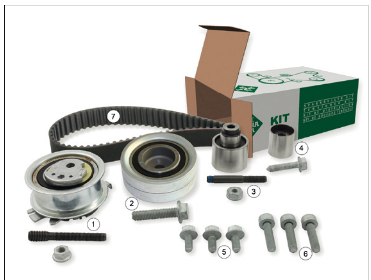
Bild 1: INA-Spannrollen-KIT 530 0550 10

Alle Komponenten des Steuertriebs sind konstruktiv auf die gleiche Lebensdauer ausgelegt und unterliegen einem gemeinsamen Verschleiß.