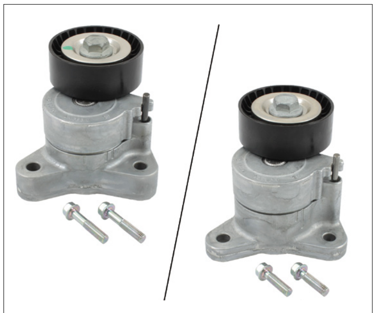
Bild 1: Spannarm 534 0325 10 – Links, alte Ausführung mit Befestigungsschrauben. Rechts, neue Ausführung mit Befestigungsschrauben.