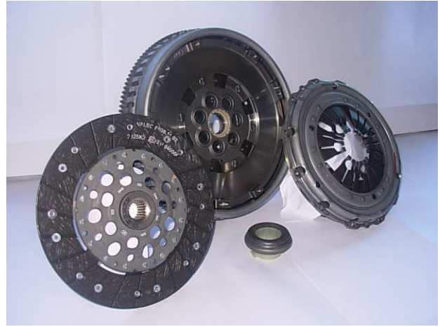
Original Kit with Dual Mass Flywheel

This clutch kit, including rigid flywheel, has been designed by Valeo engineers as a replacement to the original clutch kit & dual mass flywheel. Despite being visually different from the original clutch (including a rigid flywheel & a dampened disc instead of a dual mass flywheel & a rigid disc), Valeo guarantees that this clutch kit, if correctly installed on the vehicle, will give you full satisfaction in terms of quality, reliability & durability.