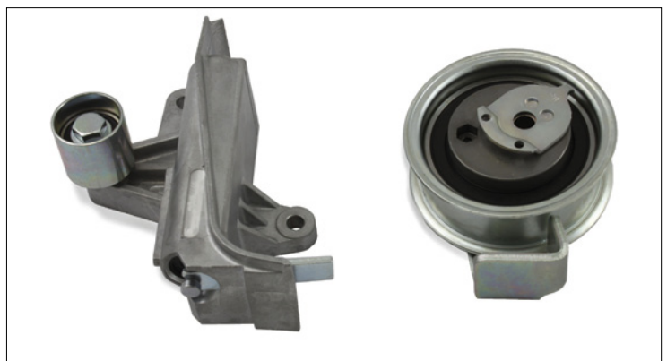
Bild 1: Links Schwingungsdämpfer 533 0028 20, rechts Spannrolle 531 0531 20,

Bei oben genannten Fahrzeugen wurde der Schwingungsdämpfer 533 0028 20 (Bild 1, links) und die Spannrolle 531 0531 20 (Bild 1, rechts) durch das KIT 530 0546 10 (Bild 2, links) und das Set 530 0546 09 (Bild 2, rechts) ersetzt.