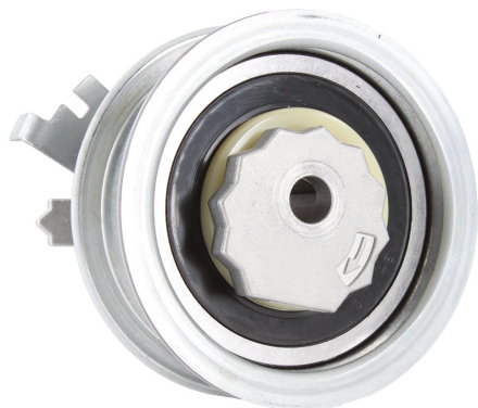
Option B | Variante B | Version B | Variante B | Variante B | Wariant B