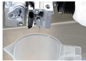
Figure 1: Drain the oil from the new compressor and determine oil quantity.

To ensure that the shaft seal ring is optimally lubricated, stand the air conditioning compressor vertically (with the belt pulley facing