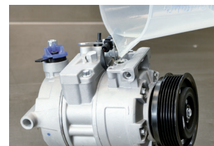
Εικόνα 2: Πλήρωση συμπιεστή με την προβλεπόμενη ποσότητα λαδιού στο σύστημα και εκ νέου σφράγιση

Για να εξασφαλιστεί η βέλτιστη λίπανση της τσιμούχας άξονα, ο συμπιεστής κλιματιστικού πρέπει να τοποθετηθεί κάθετα (με την τροχαλία προς τα κάτω) για τρία λεπτά πριν από την εγκατάσταση και, στη συνέχεια, να περιστραφεί με το χέρι για 10 φορές στην τροχαλία σε οριζόντια θέση.