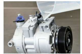
Figure 2: Pour the correct amount of oil for the system into the compressor and then reseal it.

downwards) for three minutes before installation and then, with the compressor horizontal, rotate the belt pulley ten times by hand.