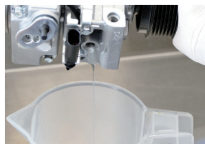
Εικόνα 1: Αποστράγγιση λαδιού από τον νέο συμπιεστή και υπολογισμός της ποσότητας λαδιού

Στη συνέχεια, ολόκληρη η ποσότητα ψυκτικού λαδιού στο σύστημα πρέπει να επαναπληρωθεί στον συμπιεστή κλιματιστικού και το βύσμα αποστράγγισης πρέπει να τοποθετηθεί με μια νέα φλάντζα (βλ. εικόνα 2).