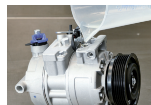
Figure 2 : Remplir le compresseur avec la quantité d'huile prévue pour le système et le refermer

orientée vers le bas) pendant trois minutes, puis tournée à la main 10 fois sur la poulie en position horizontale avant l'installation.