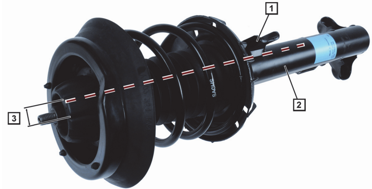
Abb. 1: Federbein